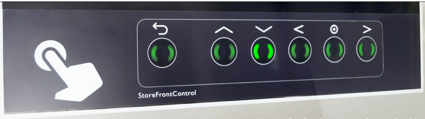
Montierte StoreFrontControl mit der Standard-Dekofolie